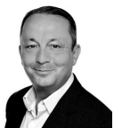
Adel Gelbert CEO

Links: C3 Website , C3 Jobs , C3 Magazine , C3 auf Facebook , C3 bei Twitter